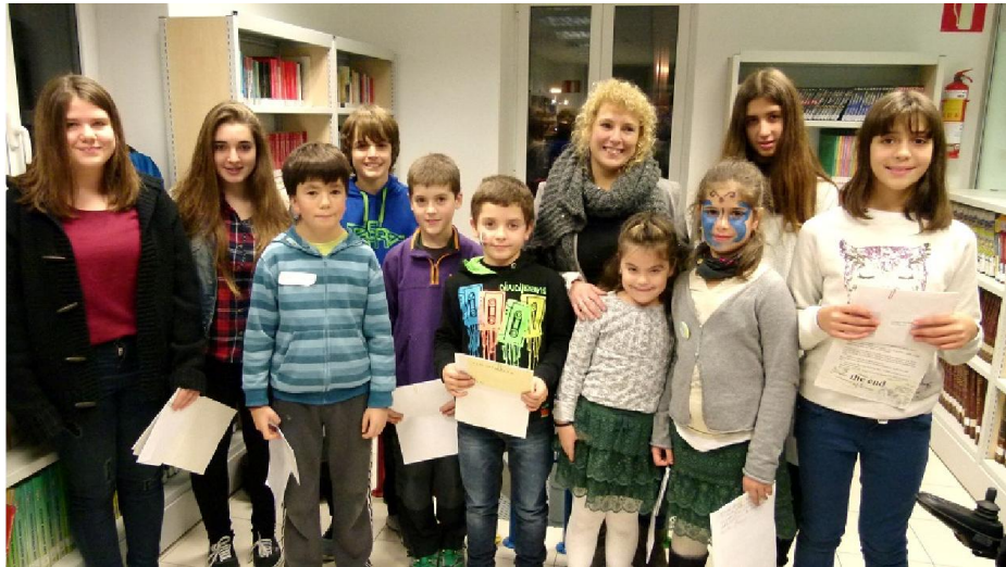
I. OrriBakaR literatur lehiaketako sari banaketa ekitaldia (Lezoko udal liburutegia. 2014ko abenduak 12).